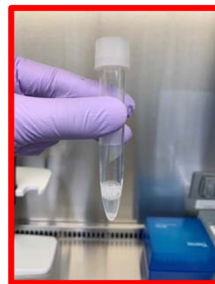
泡が多い 十分量採取されていない