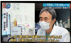
報道ステーション(20年3月3日)

新型コロナウイルスの感染が拡大した2020年から対応に苦慮する会員の声を受け、マスク等の医療資材不足をはじめ、提供体制の拡充、コナワクチン問題など徐々に国や自治体へ要請を重ねてきました。また、新興感染症にも対応しうる医療体制について、数度にわたり提言してきました。保険医協会が求めているのは、医療機関・陽性患者いづれにも安心・安全な医療となることです。