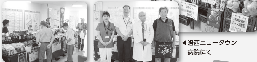
洛西ニュータウン病院にて

開催スペースをお借りしての物産展開催です。被災地支援はもちろん、患者さんやスタッフの方たちへのレクリエーションとしてもいかがでしょうか。