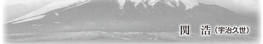
関 浩 (宇治久世)

須志神社のある吉田口(須走口)頂上では山麓の3分の2しかない薄い空気(大気圧)だといふ。簡易酸素缶も持ってきているが、どうしようかと迷っているうちに弱くなり消えた。気温は11℃、ほとんど無風と快