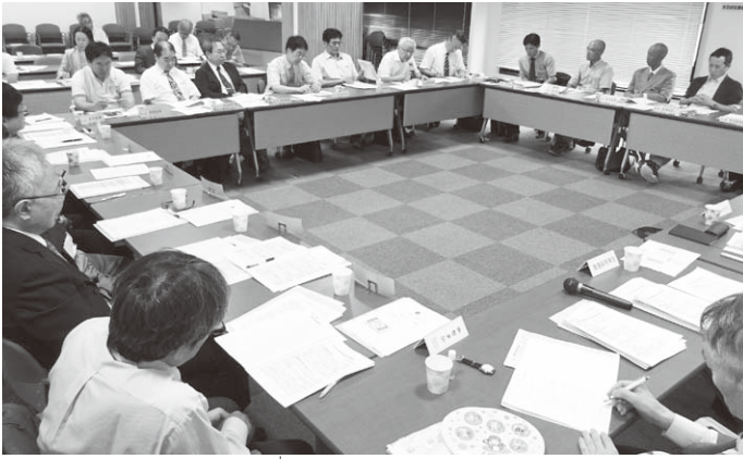
センターの設置・運営に地域差が生じていることや、財源などの問題点もあらわに。活発な意見交換となった