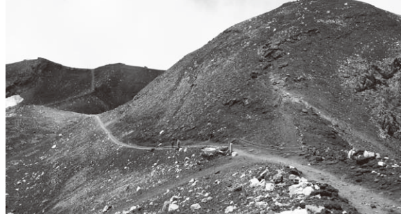
(写真2) 第2火口棚から西安河原に向かう。巡回者はまばらだった