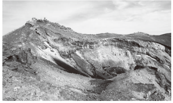
(写真1) 大内院と日本最高峰の剣ヶ峰と旧測候所