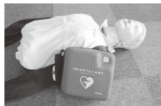
CPR対応訓練用モデル

協会では、医療安全対策の一環として医療機関向けに除細動のトレーニングにも対応できる救急蘇生モデルの貸し出しを行っています。院内や院外での除細動器を使った実践的なCPRトレーニングにご活用下さい。